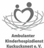
Ambulanter Kinderhospizdienst Kuckucksnest e.V.

Weitere Informationen unter: www.kinderhospizdienst-kuckucksnest.de