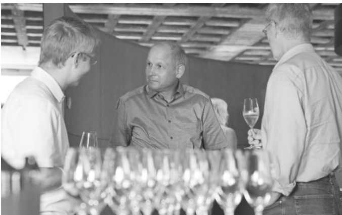
An dem Abend gab es die Gelegenheit zum lockeren Austausch.