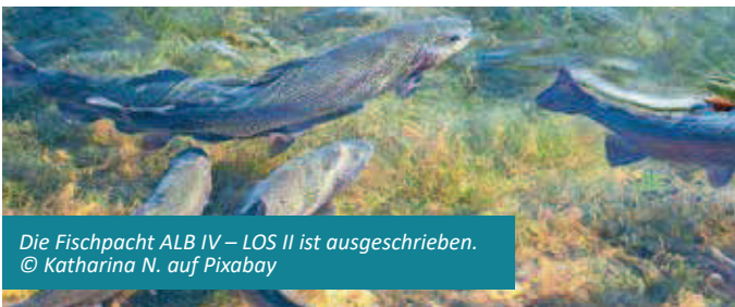
Die Fischpacht ALB IV – LOS II ist ausgeschrieben.

Quarantäne, 3G, 2G, Maskenpflicht, neueste Verordnungen: Seit dem 15. Oktober gilt in Baden-Württemberg eine neue Corona-Verordnung. Alle aktuellen Infos des Landes und des Landkreises Waldshut stellt die Stadtverwaltung regelmäßig aktualisiert auf der Homepage www.stblasien.de zusammen.