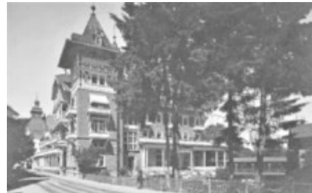
Seitenansicht des Kurhauses in der Jahrhundertwende

Öffnungszeiten Kreismuseum im Haus des Gastes: Dienstag bis Sonntag 14.30 Uhr bis 17 Uhr