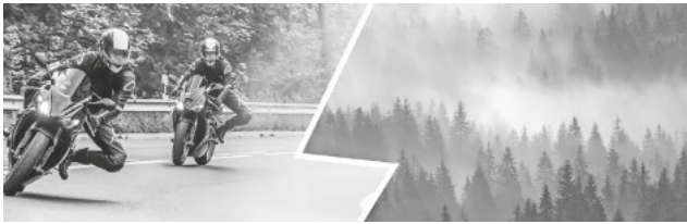
Waldesruh' vs. Motorenlärm – Wie kann es im Schwarzwald wieder ruhiger werden? © Schwarzwaldverein