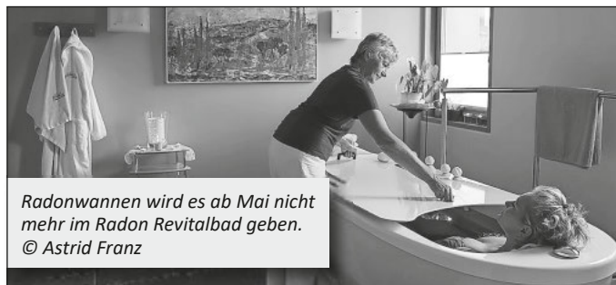
Radonwannen wird es ab Mai nicht mehr im Radon Revitalbad geben.

Die Hausanschlusskosten für den Glasfaseranschluss werden gemäß Vertrag in den kommenden Wochen in Rechnung gestellt