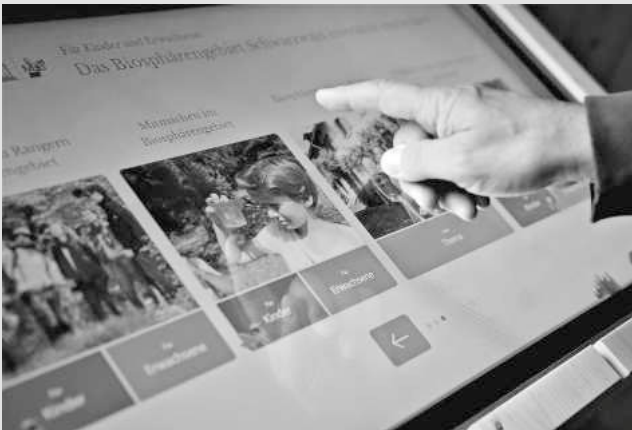
Interaktiv können Gäste das Biosphärengebiet kennenlernen.