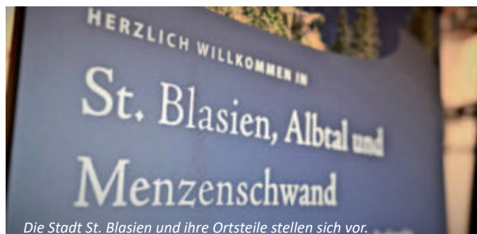
Die Stadt St. Blasien und ihre Ortsteile stellen sich vor.